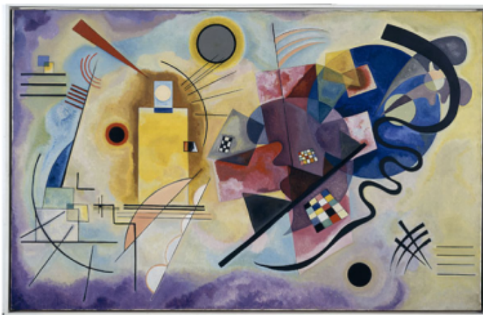
Vassily Kandinsky, Jaune-rouge-bleu , 1925 Huile sur toile, 128 x 201, 5 cm Donation Nina Kandinsky 1976 AM 1976-856 © Adagp, Paris 2007 © Photo CNAC/MNAM Dist. RMN / © Adam Rzepka

Cet article a pour but de présenter une situation pédagogique qui permet d'associer la maîtrise de la langue et l'éducation artistique poursuivant ainsi la rencontre des œuvres artistiques.